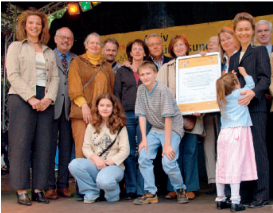
Anerkennung durch die Jury und die Sozialministerin für die ehrenamtlichen Helferinnen und Helfer des Onkologischen Forums Celle e.V.

gen Situation Hilfe und Unterstützung in zwei von ausgebildeten Therapeutinnen geleiteten Kindergruppen, die sich 14tägig in den für Stadt und Landkreis Celle zentral gelegenen Räumen der Stadtkirchengemeinde treffen. Dort erhalten Kinder im Alter von sechs bis 13 Jahren die Möglichkeit, offene Fragen zu stellen, sich mit anderen auszutauschen und über ihre Erfahrungen zu sprechen. Die Teilnahme an der Gruppe basiert auf der eigenen Entscheidung der Kinder und sollte für ein halbes Jahr verbindlich sein. Für die Jugendlichen ab 14 Jahren, die sich erfahrungsgemäß nur schwer in eine feste Gruppe einbinden lassen, finden in dreimonatigen Abständen Tagesseminare im Jugendzentrum CD-Kaserne in Celle statt.