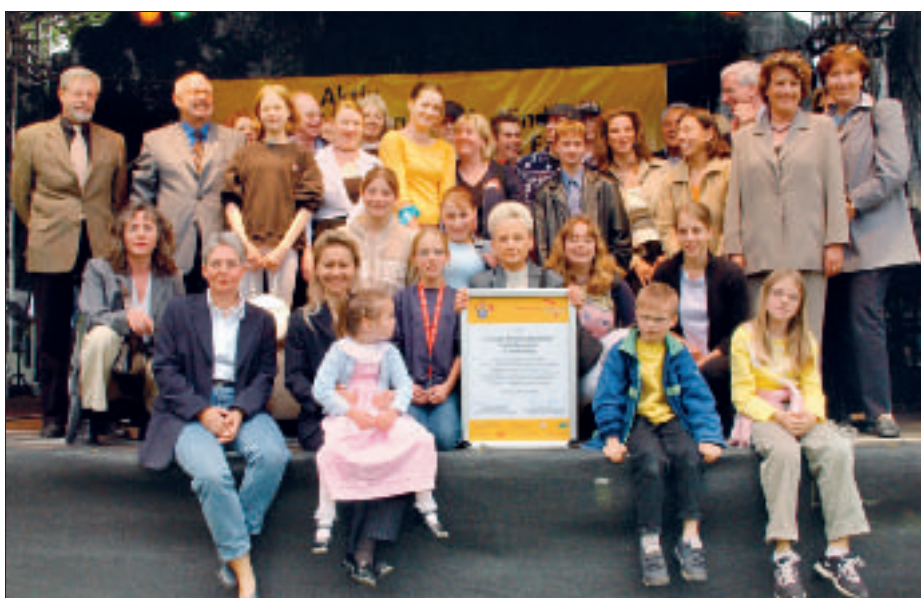
Freude strahlend zeigt sich die Abordnung der „Kindertafel“ nach der Preisverleihung gemeinsam mit den Jurymitgliedern und der Sozialministerin.

Da an allen Schultagen und zu festen Zeiten ein warmes Mittagessen angeboten wird und dies bereits über einen längeren Zeitraum, wurde auch die Verlässlichkeit dieses Angebots gewürdigt.