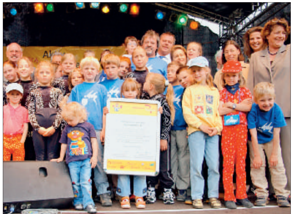
Großes Gedränge gab es auf der Bühne bei der Preisverleihung an den Wassersportverein Bennigsen.

Das freiwillige Engagement der Bennigser hat dafür gesorgt, dass die Kinder an eine so wichtige und gesunde Bewegungsform wie das Schwimmen herangeführt werden und der Leitsatz des Ortes „Kein Bennigser Kind soll die Grundschule verlassen, ohne schwimmen zu können“ auch künftig in die Praxis umgesetzt werden kann.