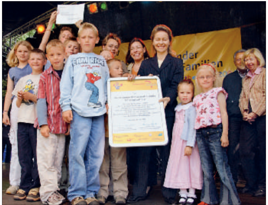
Sozialministerin Ursula von der Leyen überreicht den Kindern und Jugendlichen aus Schwagstorf die Urkunde für die beispielhafte Arbeit des Fördervereins.