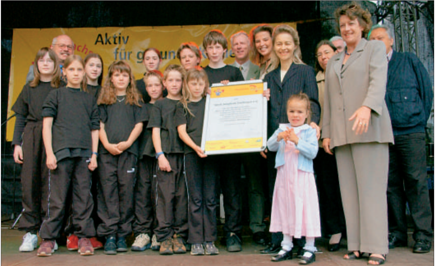
Nach der Siegerehrung ging es gleich zum Auftritt: Kinder und Jugendliche der Sportjongleure Dreilingen im Kreis der Jurymitglieder und der Sozialministerin.

Der Sportjongleure Dreilingen e.V. animiert seit zehn Jahren generationsübergreifend Kinder, Jugendliche und Erwachsene in Dreilingen zum Jonglieren, zur Akrobatik und kleinen Bewegungskunststücken. Inzwischen hat der Verein Mitglieder aus der gesamten Region gewonnen, die diese Bewegungsangebote nutzen. Außerdem besteht eine Kooperation mit einer Ganztagschule und einer Sonderschule für Lernhilfe, so dass diese ausgefallene Sportart auch zusätzliche Bewegung in das Schulleben bringt und die soziale Kompetenz fördert.