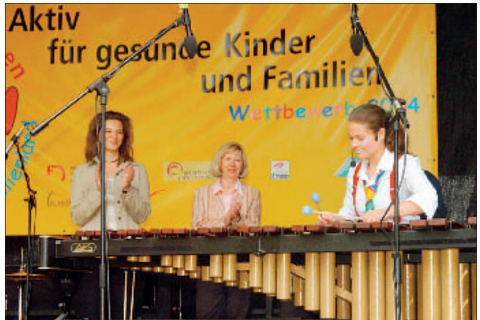
„Clownesse“ (r.) sorgte neben anderen Künstlern für gute Stimmung auf der Abschlussveranstaltung.

Vielen Erkrankungen von Kindern und Jugendlichen kann mit relativ einfachen Mitteln vorgebeugt werden: Mit viel Bewegung an frischer Luft und gesunder Ernährung. Wichtig ist dabei das Vorbild der Eltern und anderer Erwachsener, um den Kindern zu zeigen, dass zum Beispiel Rauchen, Alkohol und zu fetthaltige Nahrung mit zunehmendem Alter krank machen.